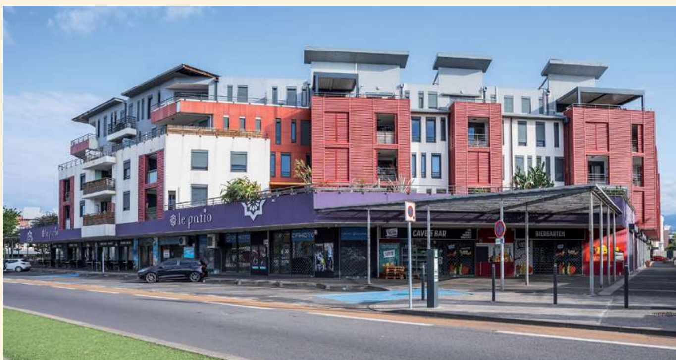
▲ Le Patio, front de mer de Saint-Pierre.

Aujourd'hui, la SOREC franchit une nouvelle étape avec la création d'Isautier Patrimoine & Promotion , qui rassemble désormais toutes les activités immobilières du Groupe sous une identité unique. Cette nouvelle organisation articulée autour de trois métiers complémentaires : l'aménagement (lotissements résidentiels ou à vocation économique), la promotion (bâtiments d'habitation, professionnels ou mixtes) et la foncière (gestion d'un portefeuille d'actifs acquis ou développés en interne) incarne la volonté du groupe de structurer durablement son action au service du territoire.